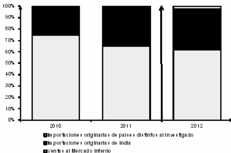
Gráfica 1. Consumo interno de metoprolol