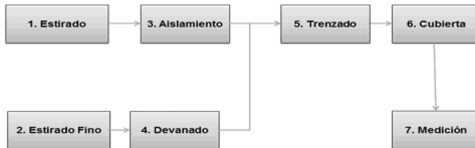
Diagrama del proceso de producción de cable coaxial