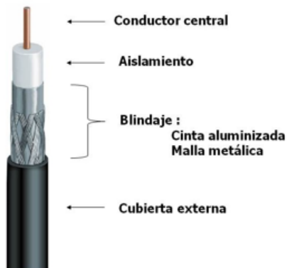
Componentes de un Cable Coaxial