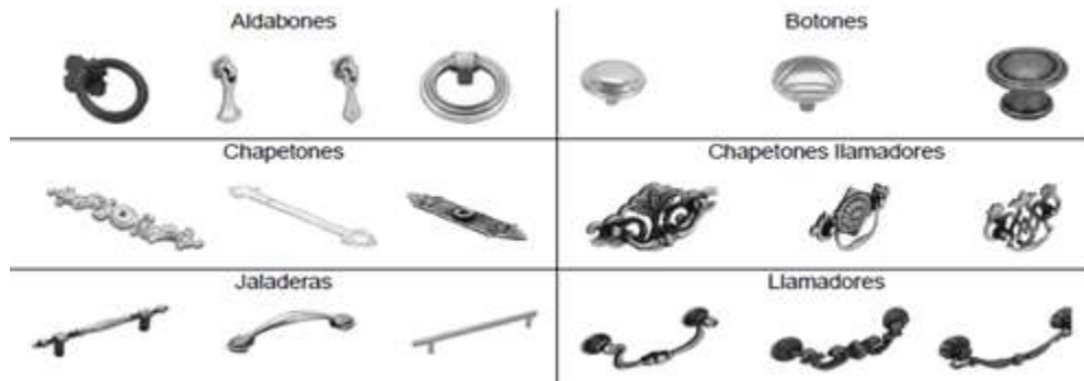
Ilustración 2. Jaladeras de zamac

9. Los tipos de jaladeras de zamac incluidos en la investigación son estrictamente jaladeras, botones, chapetones llamadores, llamadores, chapetones y aldabones, como los que se ejemplifican en la Ilustración 2.