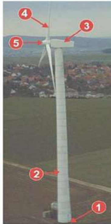
Ilustración de torre eólica